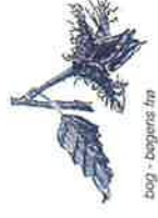
bøg - bogens træ

være blandt de flotteste i Danmark. En del af bølgebevoksningerne er særligt udvalgte – forstfolkene siger »kårede« – så frøet fra dem må handles. På arealet nord for Næstvedvej er der høstet adskillige tons bøgefår, som via en mellemstation på danske planteskoler vokser frem som ny bøgeskov i Danmark. Bøgen befinder sig i Danmark nær nordgrænsen for dens udbredelse, hvilket bl.a. udmønter sig i, at den ikke bærer frø hvert år. I gennemsnit over en lang periode sker det ca. hvert 7. år, men de seneste 15 år har der været hele seks frøår. Gå til venstre ad Næstved Landevej frem til 1. skovvej på højre hånd.