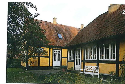
2. Huset bliver første gang omtalt af en beboer i 1733 og menes at være bygget i starten af 1700-tallet.